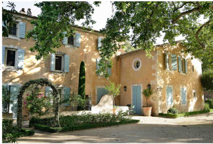
Célébrer une nuit de nocces à Baumanière en Provence

Le jour J arrive à grand pas ? Et si vous fêtiez ce grand évènement dans un endroit hors du commun ? Découvrez notre éventail de destinations exceptionnelles avec une sélection soignée d'hôtels où passer sa nuit de noce.