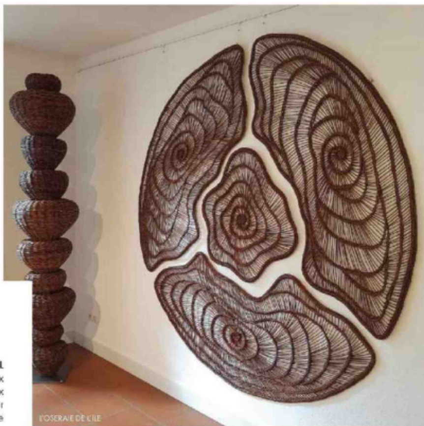
L'OSERAIE DE L'ÎLE

«Je chine aux PUCES DE SAINT-MICHEL depuis très longtemps, ce coin du vieux Bordeaux est encore préservé. Le mieux est d'y aller tôt, le dimanche matin, pour trouver la plus grosse concentration de professionnels et de vrais brocanteurs... Il y a toujours un melting-pot de personnes qui déballetent, c'est un doux bazar à l'atmosphère authentique ! On y déniche de petits objets hétéroclites de qualité – de la vaisselle, des tableaux, des cadres, des miroirs –, pour une dizaine d'euros... Il y a même du petit mobilier, et une vraie marge de négociation. J'aime bien discuter avec les différents marchands, c'est l'occasion de découvrir d'autres adresses, ailleurs en France. C'est comme ça que j'ai connu les Pucés d'Albi, par exemple.» 17, rue des Faures, Bordeaux.